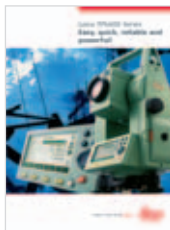
Leica TPS400 Catálogo producto

Los datos técnicos, las ilustraciones y descripciones no son vinculantes y pueden ser modificados. Impreso en Suiza – Copyright Leica Geosystems AG, Heerbrugg, Suiza, 2005. 725904es – 1.06 – RDV