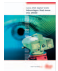
Leica DNA Catálogo producto