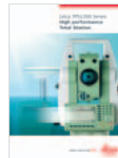
Leica TPS1200 Catálogo producto