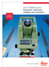
Leica TPS800 Folleto del producto

La marca Bluetooth ® y sus logotipos son propiedad de Bluetooth SIG, Inc. y cualquier uso de tales marcas por Leica Geosystems AG se realiza bajo licencia. Windows CE es una marca registrada de Microsoft Corporation. Otras marcas y nombres comerciales son de sus respectivos propietarios.