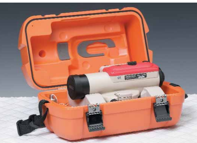
Su distribuidor Pentax autorizado:

** : Con micrómetro de placa plano-paralela.